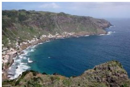
Ilha de Santa Maria Duração: 8h00

O passeio oferece a possibilidade não só de apreciar as mais belas paisagens da Ilha, mas como também de desfrutar dos seus encantos. Este passeio inclui pontos de interesse geológico, maravilhosas baías e património histórico e cultural.